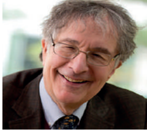
Prof. Dr. Howard GARDNER (Guest of Honor)

Üsküdar Üniversitesi Kurucu Rektör / Founding Rector / President of Congress “Trauma Sonrası Büyüme” / “Post-Traumatic Development”